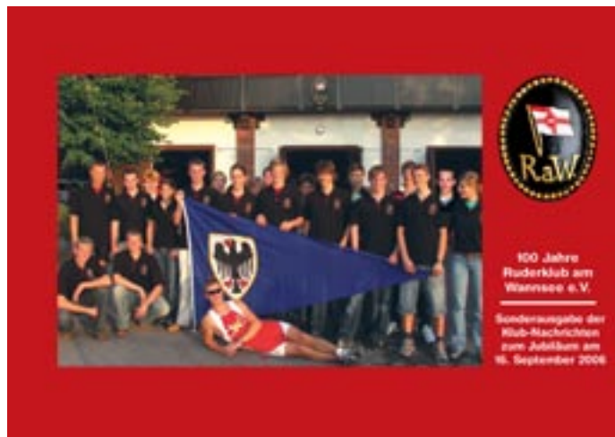
Das Cover der Sonderausgabe. Das Foto stammt im übrigen von Klaus Schüler, was im Impressum unglücklicherweise nicht erwähnt wurde.

„Welch schöne Überraschung! Herzlichen Dank für die sehr schöne, gelungene Sonderausgabe der Klub-Nachrichten zum Jubiläum. Ich habe mich sehr darüber gefreut. Es wird eine wunderbare Erinnerung sein an das großartige Jubiläums-Fest. (...) Wir hatten uns sehr darüber gefreut, dass wir uns mit Ihnen per Zufall am „Festschrift-Stand“ getroffen haben und ein so nettes Gespräch zusammen hatten. Die Verbindung mit dem RaW ist uns sehr wichtig, durch meinen lieben Mann haben wir ja all die Jahre einen sehr engen Kontakt gepflegt und für meine Tochter und mich ist es ganz wichtig, dies auch weiterhin zu tun. (...) Lieber Herr Sturm, die Sonderausgabe ist wirklich wunderschön geworden, reizende Fotos, sehr nette Beiträge, man erlebt das große Jubiläumsfest noch einmal und hat eine so schöne Erinnerung daran.“